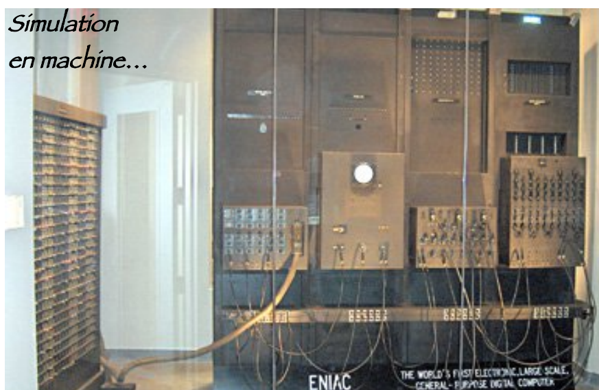
Éléments de l'ENIAC au musée à la Pennsylvania University, USA